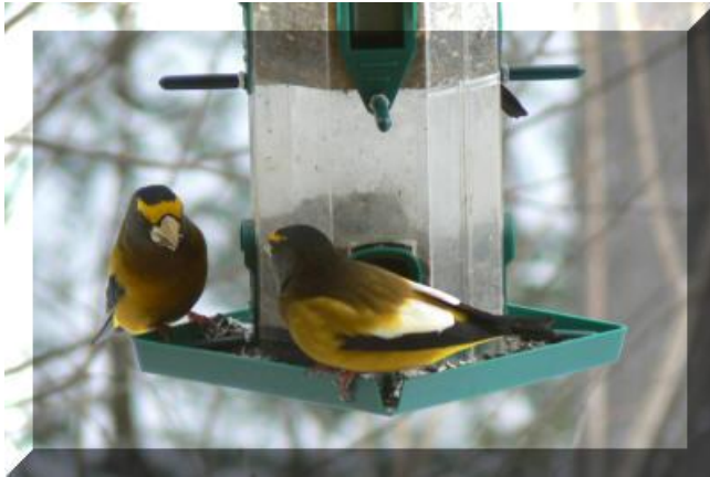
Gros bec errant ♂ Cliquez pour agrandissement Prise de vue : Chemin du Huard