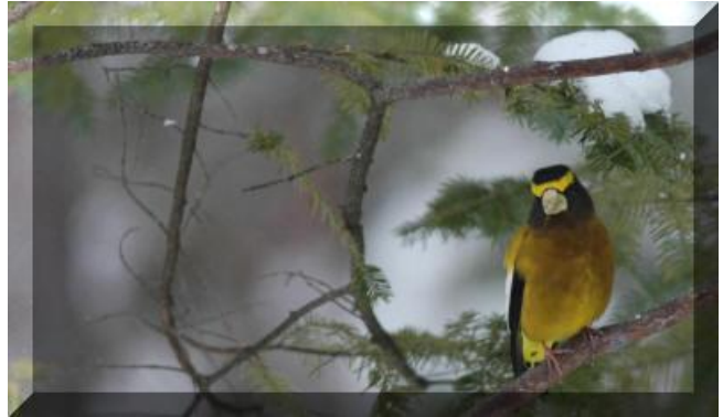
Gros bec errant ♂ Cliquez pour agrandissement Prise de vue : Chemin du lac Carillon