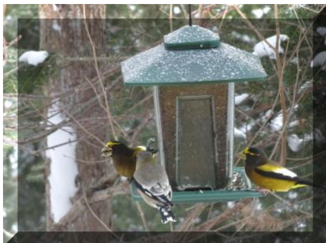
Gros bec errant ♂ ♀ Cliquez pour agrandissement Prise de vue : Chemin du Huard

Habitat : Forêts de conifères ou mixtes.