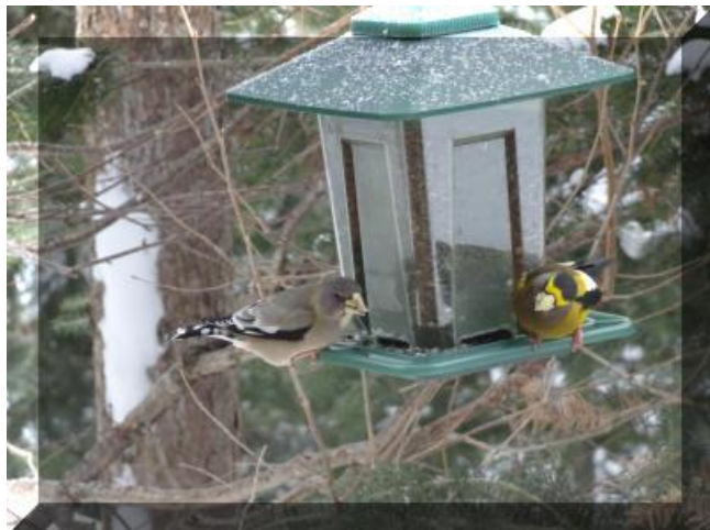
Gros bec errant ♂ ♀ Cliquez pour agrandissement Prise de vue : Chemin du Huard

♂ : Bec fort et conique. Grande tache blanche sur les ailes noires. Épais sourcil jaune. Tête brunâtre. Corps jaune. Queue noire.