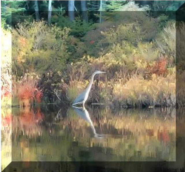
Héron garde-boeuf ♂ ♀