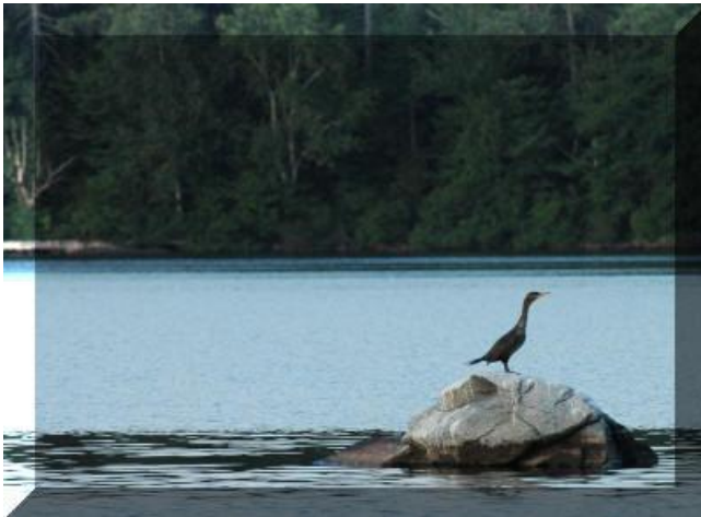
Grand cormoran ♂ ♀ Cliquez pour agrandissement Prise de vue : Lac Carillon

Nidification : Niche, nid posé sur une corniche, 3 à 5 œufs couvés par ♂ et ♀ durant 28 à 31 jours, nidicole. 1 er envol après 50 jours.