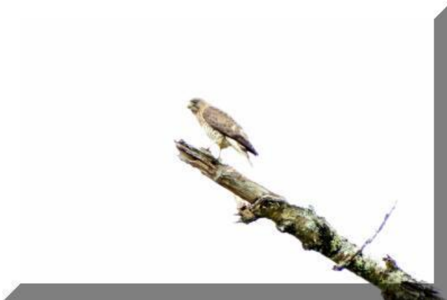
Petite buse J

Cliquez pour agrandissement Prise de vue : Chemin du Huard