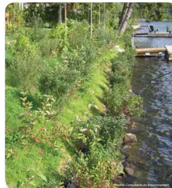
Biofilia Consultants en Environnement